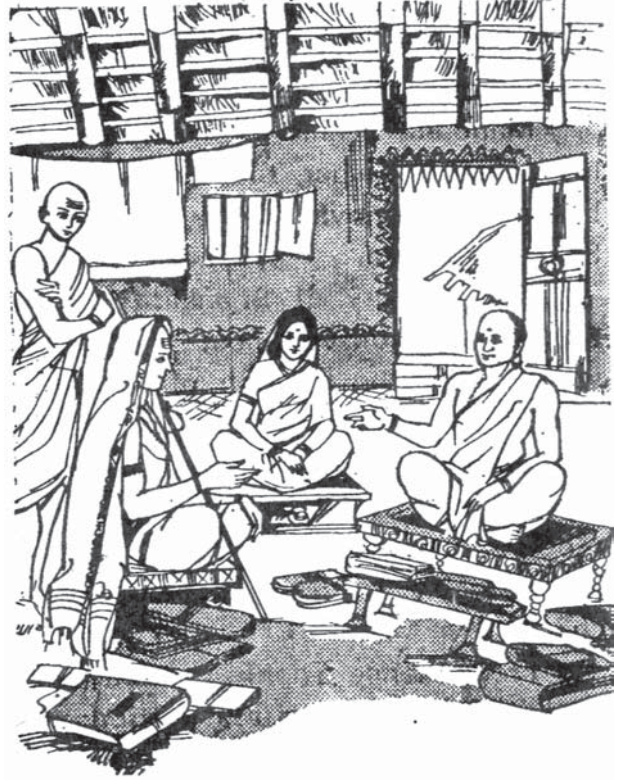
మండనమిశ్రుడికి శంకరాచార్యులకు మధ్య శాస్త్ర చర్చ

తరువాత శంకరుడు పవిత్ర శ్రీశైలక్షేత్రం వెళ్ళాడు. ఉగ్రభైరవుడనే కుటిల తాంత్రికుని ఓడించాలనే ఉద్దేశ్యంతో