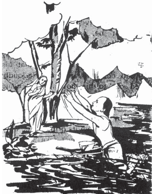
అమ్మా! నన్ను మొసలి పట్టుకొన్నది సన్యాసాశ్రమం స్వీకరించడానికి అనుమతి నివ్వ

బ్రహ్మ సాక్షాత్కారం పొందిన గురువు అన్వేషణలో శంకరుడు ఉత్తరంవైపునకు వెళ్ళాడు. నర్మదానది తీరంలో ఒక