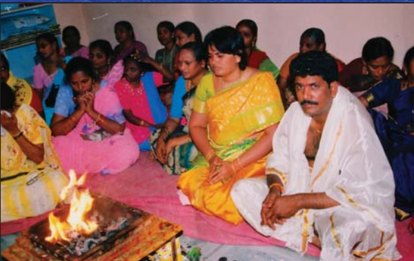
బాపట్లలో యజ్ఞం జరుపుతూన్న వెంపరాల పూర్ణచంద్రరావు దంపతులు.