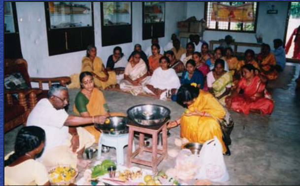
భీమిలి శక్తిపీఠంలో రుద్రాభిషేకం.